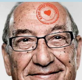
Mensch. Auch mit Demenz.

Erfahren Sie Näheres über die vom MGEPA und dem Landesverbänden der Pflegekassen NRW/dem Verband der Privaten Krankenversicherungen e.V. geförderten Kampagne unter: